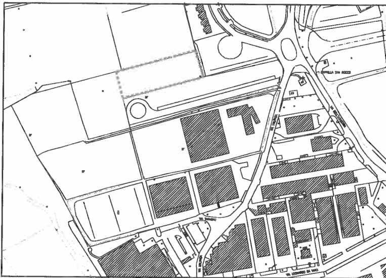
Estratto rilievo aerofotogrammetrico comunale