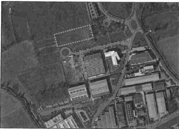
Vista aerea - Ortofoto