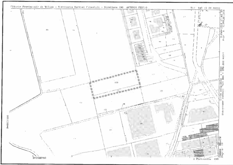
Estratto di Mappa Catastale - Comune di Rosate - Fig. 19